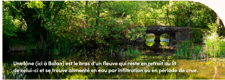
Une lône (ici à Balan) est le bras d'un fleuve qui reste en retrait du lit de celui-ci et se trouve alimenté en eau par infiltration ou en période de crue.