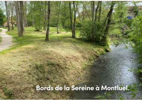
Bords de la Serein à Montluel.